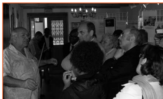
Le groupe sur les traces de l'Abbé Grégoire et de Toussaint Louverture

Après une nuit à Saint-Dié-des-Vosges, le dimanche 14 mai, direction la France-Comté. Visite le matin de la Maison de la négritude et des Droits de l'Homme à Champagny puis du Fort de Joux, où Toussaint Louverture, organisateur de l'insurrection de Saint Domingue (Haïti) en 1791 fut emprisonné et où il décéda le 7 avril 1803.